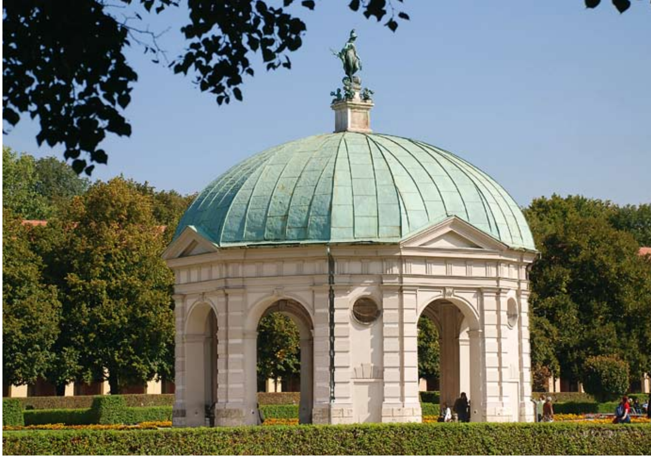
Oben: Der Diana-Tempel von Heinrich Schön (um 1615) im Hofgarten, bekrönt von einer Kopie von Hubert Gerhards Bronze „Tellus Bavarica“