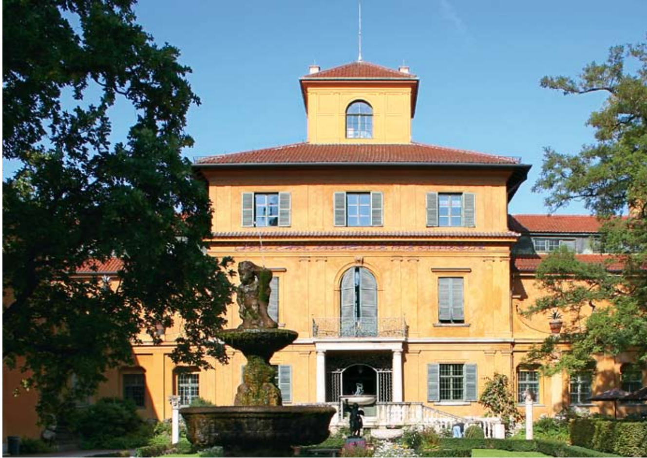
Oben: Das Lenbachhaus von Gabriel von Seidl (1887/91); Foto: Gabriele Huber Unten: Mauro-Staccioli-Ring (1996) und das neue Rocco-Forte-Hotel „The Charles“ am Alten Botanischen Garten (1813)